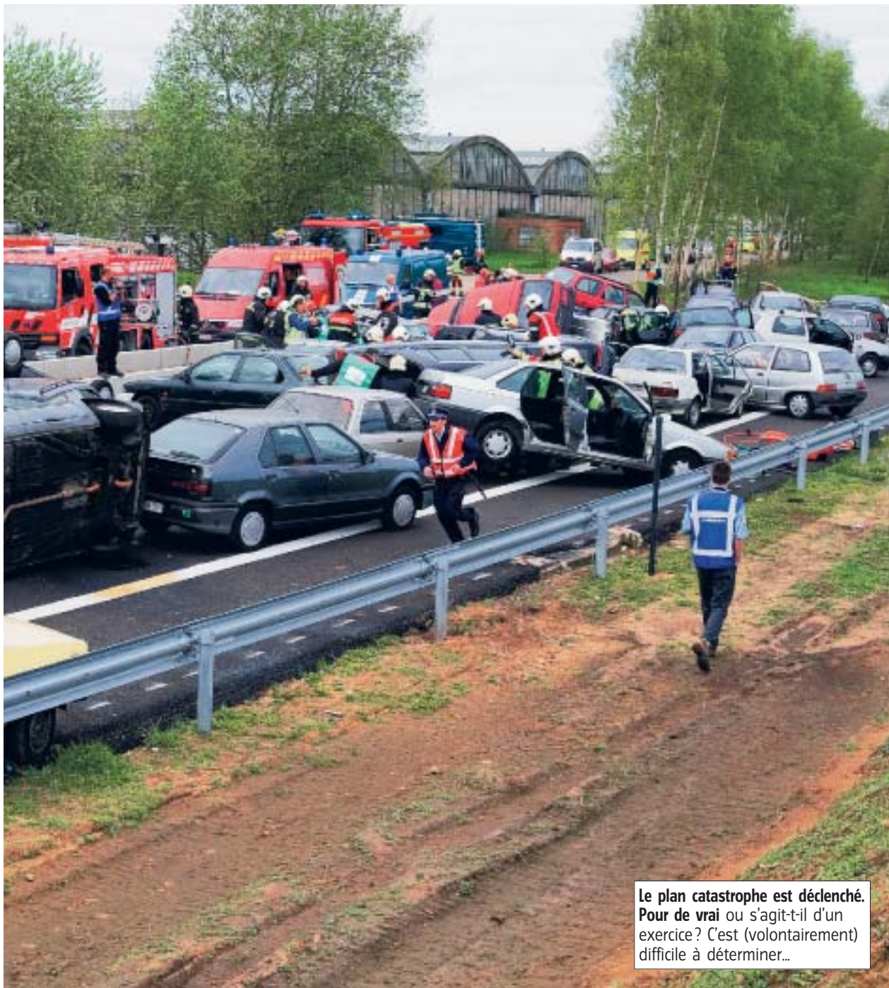
Le plan catastrophe est déclenché. Pour de vrai ou s'agit-il d'un exercice? C'est (volontairement) difficile à déterminer...